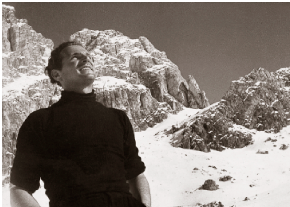
Sotto il Sett Sass.

giorno, c'era il sole, e i piccoli dei mandriani che, sdraiati su l'erba custodivano il maiale o la capra, ci correvano incontro chiedendoci se volevamo una tazza di latte, oppure ci offrivano piccoli mazzi di stelle alpine o di rododendri. E noi eravamo contenti di dare qualche moneta a questi piccoli, che si scostavano un po' per contarle di nascosto.