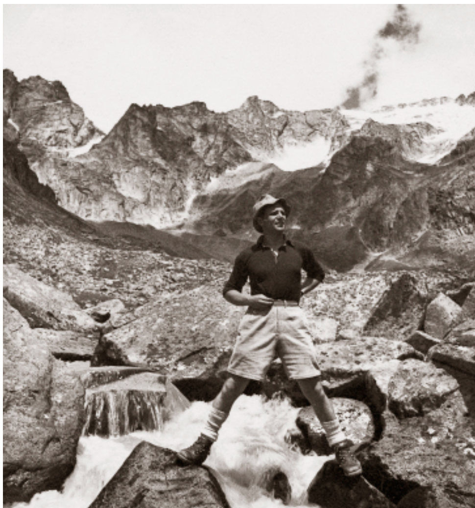
Nei pressi del rifugio Prudenzini, 1942.

Ci leviamo gli orologi dal polso e li mettiamo nei taschini.