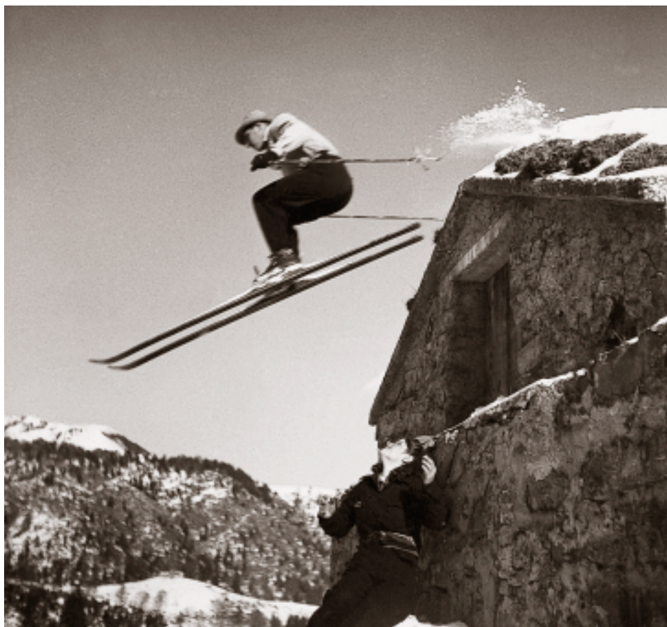
Vaghezza, primo febbraio 1942.

Ad una svolta del sentiero vediamo finalmente spuntare dietro le ultime pietre accatastate, la cima: la luce ancora debole non ci permette di vederne bene i particolari. Avanzando ancora ci appare tutta la parete Ovest come un libro aperto. La Nord si vede di profilo come un libro chiuso.