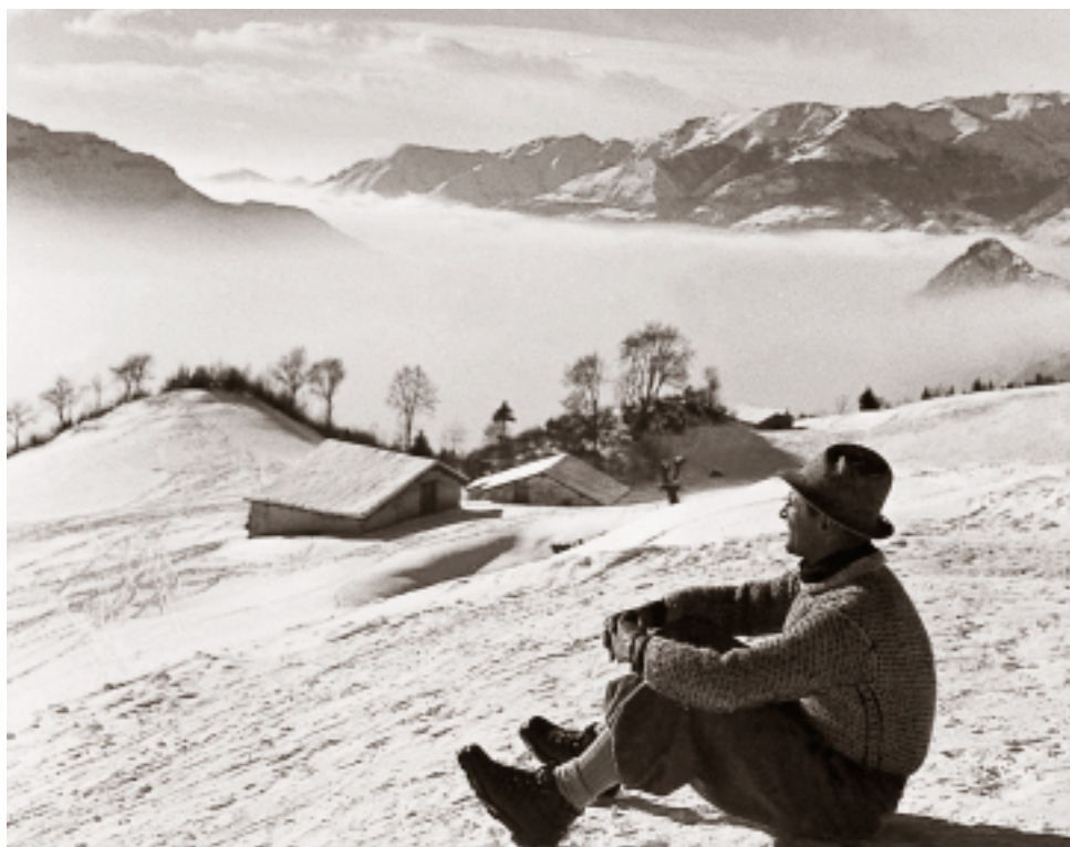
Piani di Vaghezza, gennaio 1942.

andrebbe al cinematografo o ad una festa da ballo. Facili conquistatori di altezze comode.