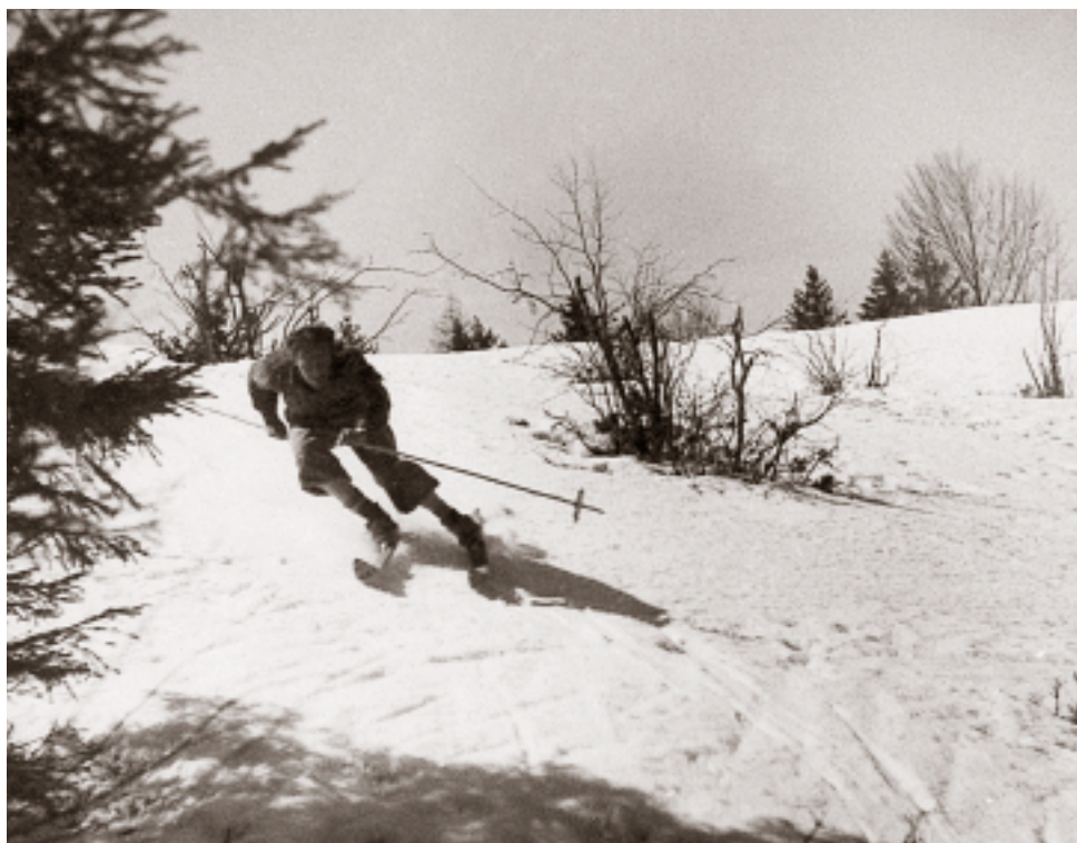
Monte Ario, aprile 1944.