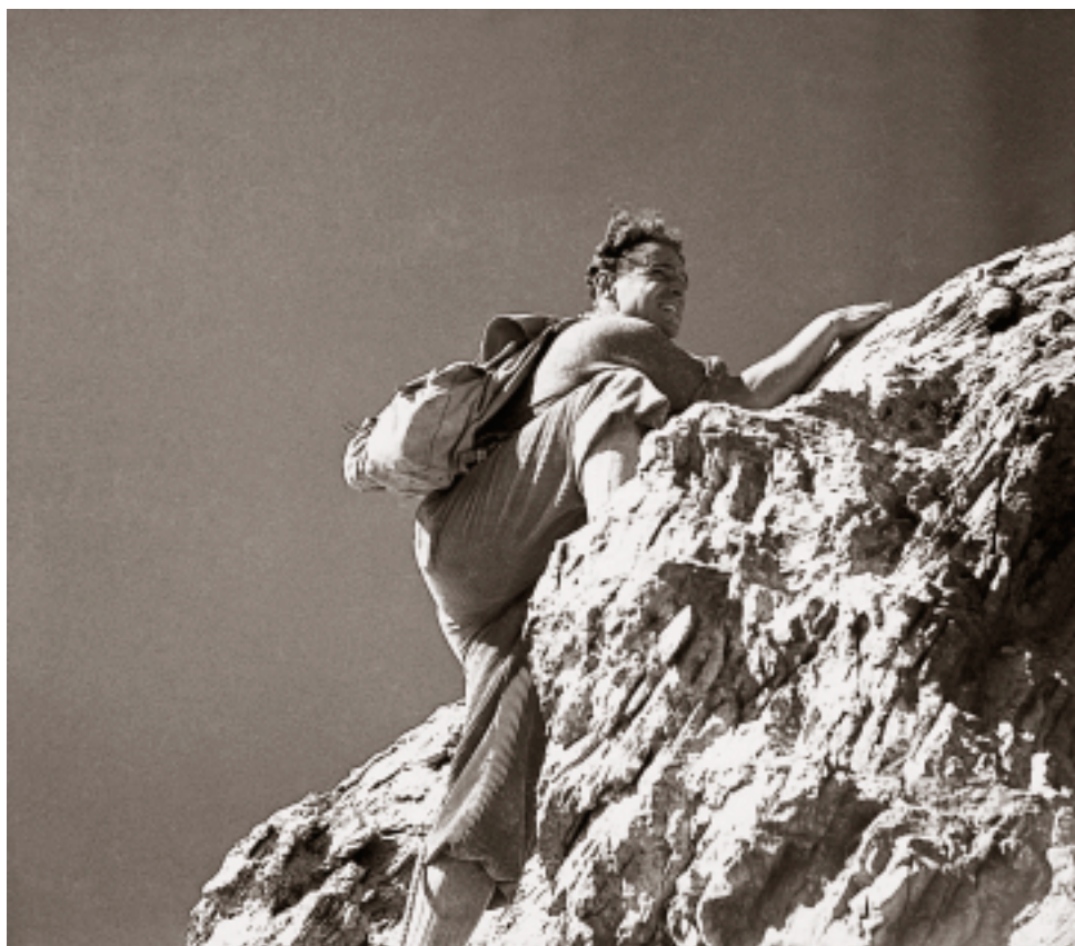
Corna Blacca, ottobre 1942.

Qui non c'è nulla: l'isolamento assoluto: non c'è che l'ombra di una cordata che scivola sulla parete nuda.