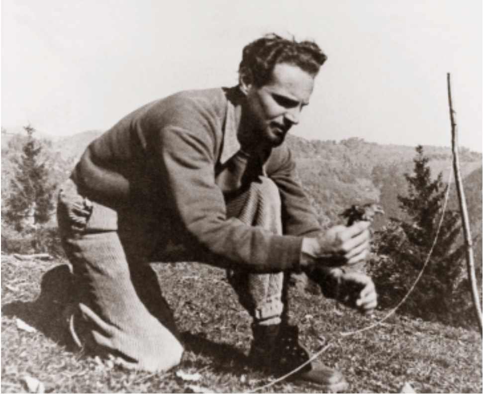
Liberando un uccellino da una trappola.

in cerca di un altro appoggio: l'ha trovato; ora è l'altro piede che cerca e finalmente tutto il corpo avanza lungo la strana via del cielo. Tutto questo movimento non è altro che l'esecuzione di un ordine dato dal cervello.