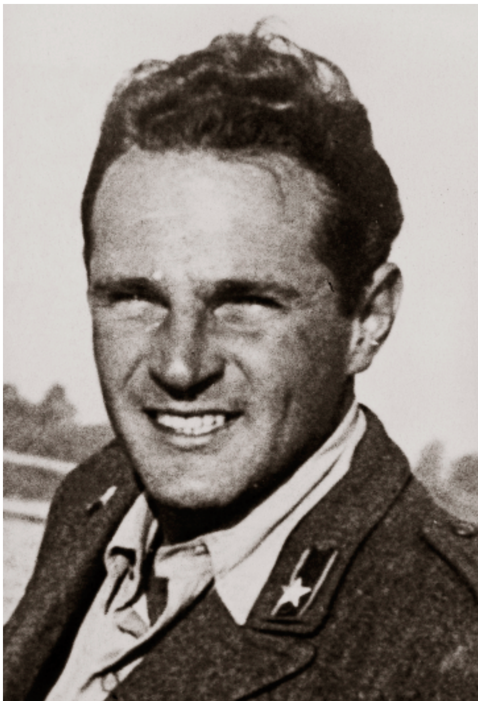
In uniforme a Mantova.