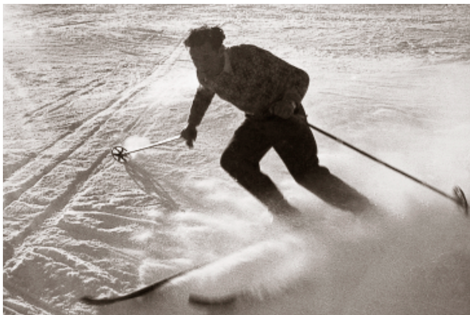
Vaghezza, 4 gennaio 1940.

Mentre camminiamo guardiamo le stelle: quante sono! Ecco il Carro, ecco Venere, la più lucente; la stella del pastore come dicono i montanari. Sono tanto lontane. Oggi faremo un piccolo passo verso di loro. La nostra mente vola, vola senza posa più in alto, là dove la montagna assume un aspetto più maestoso: dove inizierà la battaglia contro la parete che attende impavida il nostro attacco.