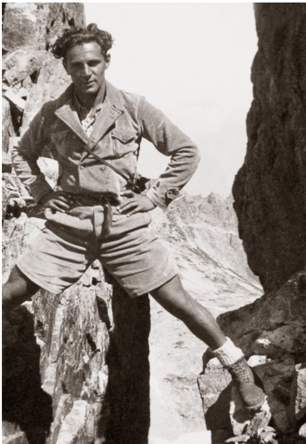
In posa fra le rocce.